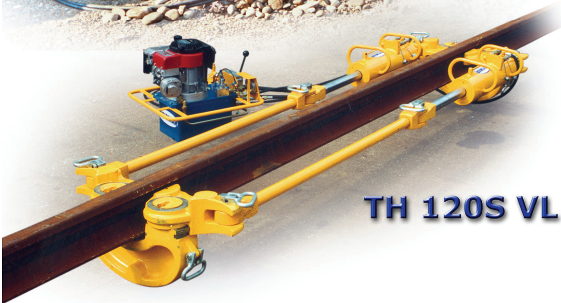
TH 120S VL