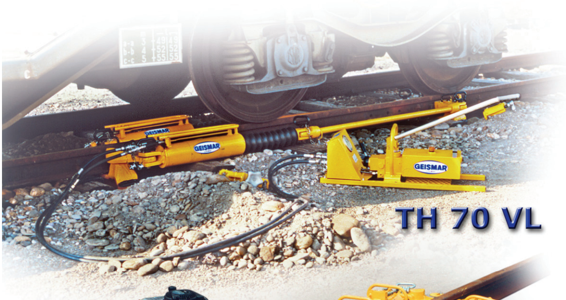
TH 70 VL